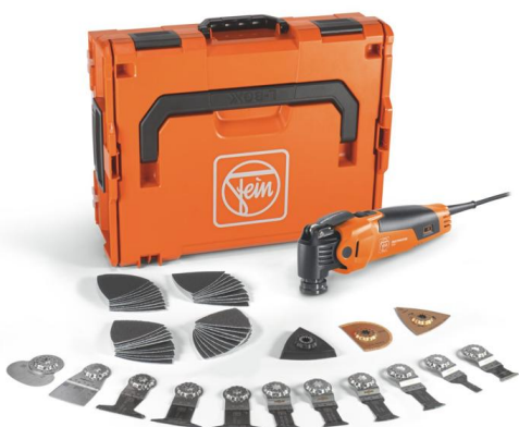
Bildunterschrift: Multimaster MM 500 PLUS Selection mit 55 Zubehören für vielseitige Anwendungen.