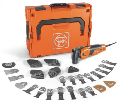
Bildunterschrift: Multimaster MM 700 MAX Selection mit umfangreichem Zubehör von 62 Teilen.

Die hochauflösenden Fotos und diesen Text finden Sie zum Download im FEIN Pressebereich unter: