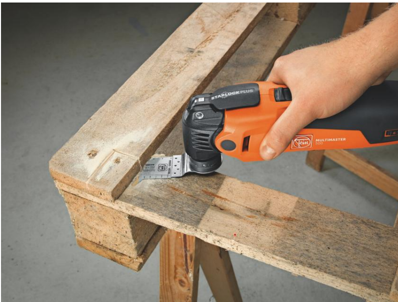
Tekst bij foto: Snel en nauwkeurig zagen in hout met het FEIN TiN-zaagblad.