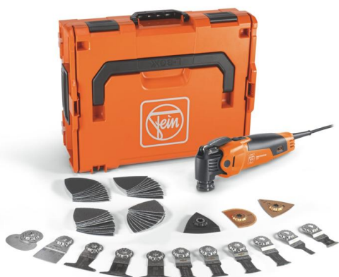
Pie de foto: MultiMaster MM 500 PLUS Selection con 55 accesorios para múltiples aplicaciones.