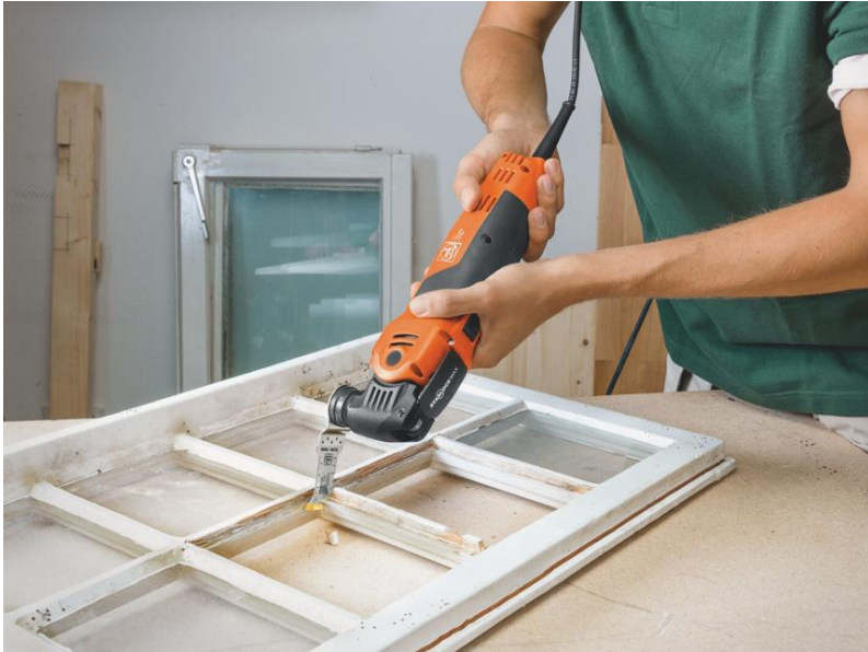
Didascalia: Lavorazione precisa su telai di finestre con FEIN MultiMaster e la giusta lama rivestita in nitruro di titanio.