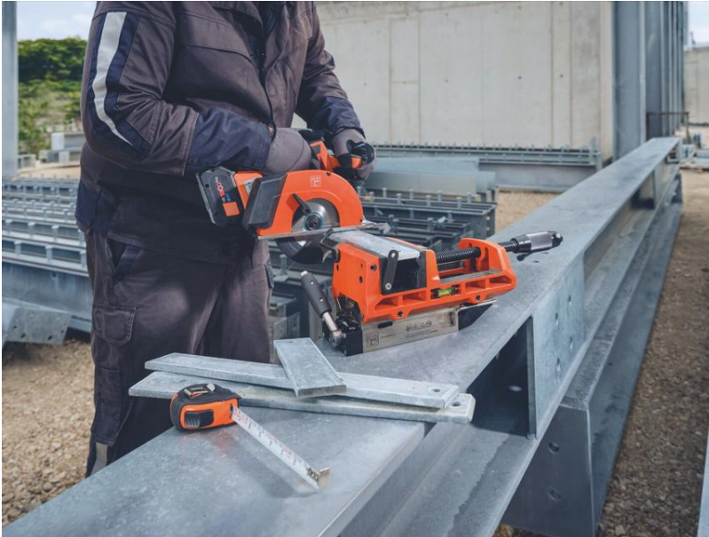
Bildunterschrift: Schnelle serielle Arbeit dank Bauteil- und Tiefenanschlag für exaktes Bohren und Ablängen.