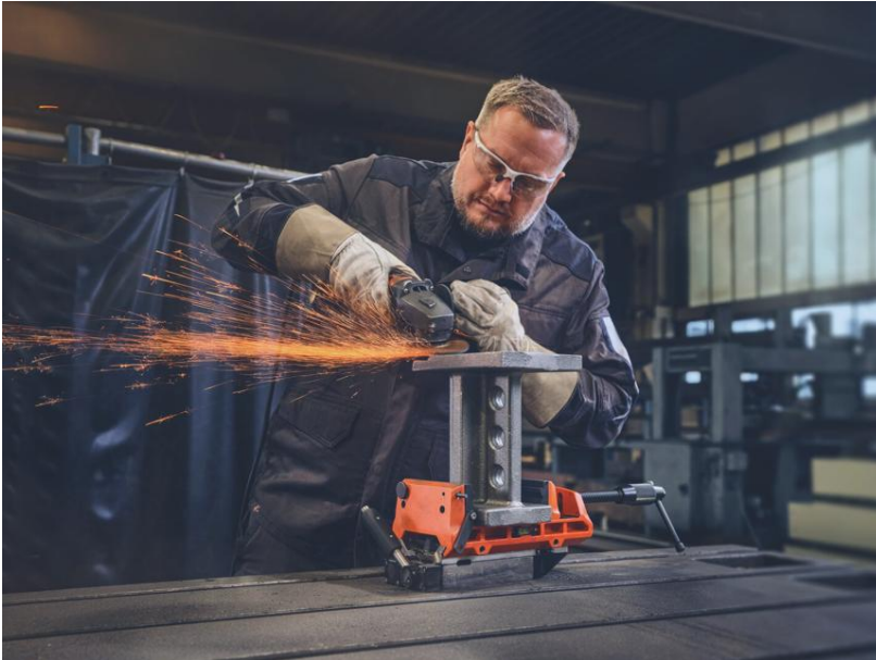
Bildunterschrift: Zuverlässige Fixierung für präzise Bearbeitung in der Werkstatt mit dem VersaMAG Vise 160 L.