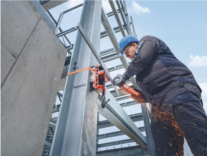
Légende : Une stabilité totale, même en déplacement : l'étau VersaMAG VISE 160 L en intervention sur le terrain.