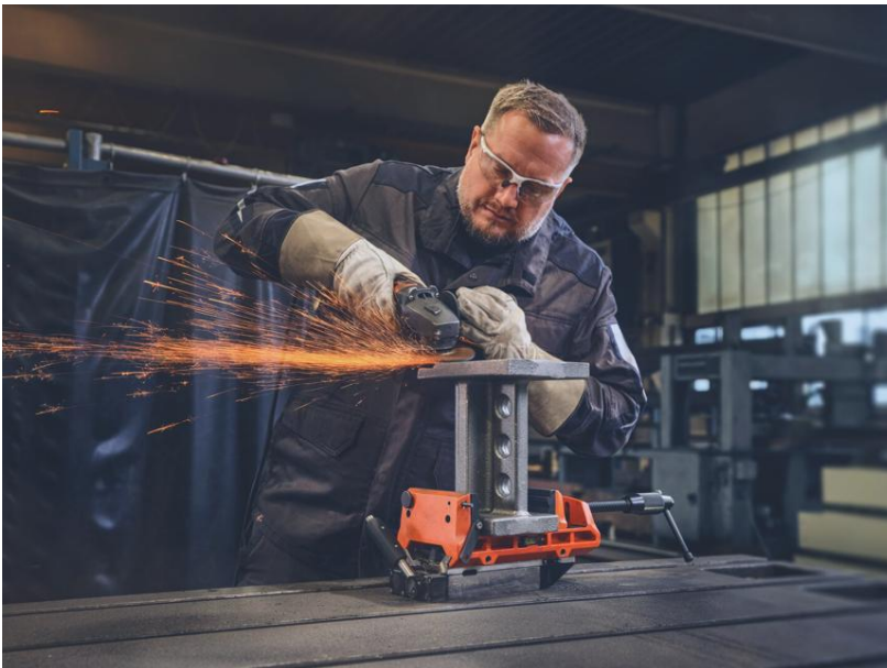
Légende : Une fixation fiable pour un usinage précis en atelier grâce à l'étau VersaMAG Vise 160 L.