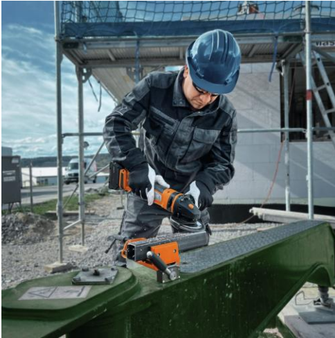
Imagen: El Sistema VersaMAG de FEIN es un solucionador de problemas: seguro y limpio en los sitios de construcción evitando largos tiempos de preparación.

Prensa | FEIN POWER TOOLS IBERICA, S.L.U.