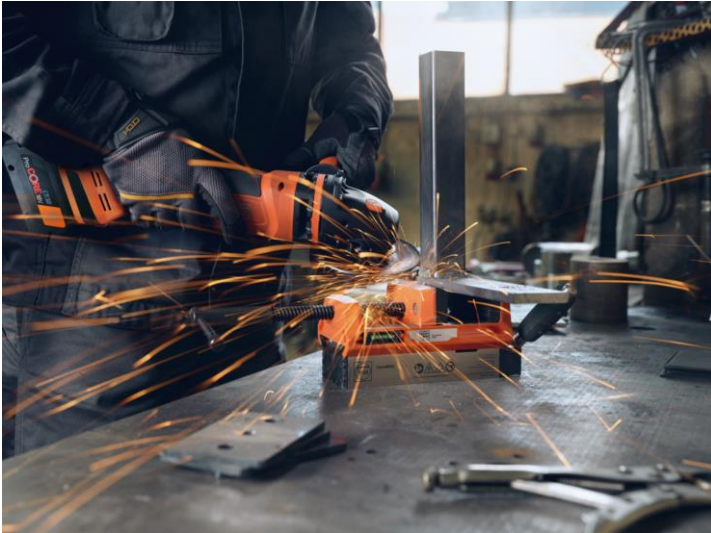
Imagen: El tornillo de banco VersaMAG de FEIN permite infinidad de aplicaciones; se puede combinar con otras herramientas eléctricas, en la obra o en el taller.