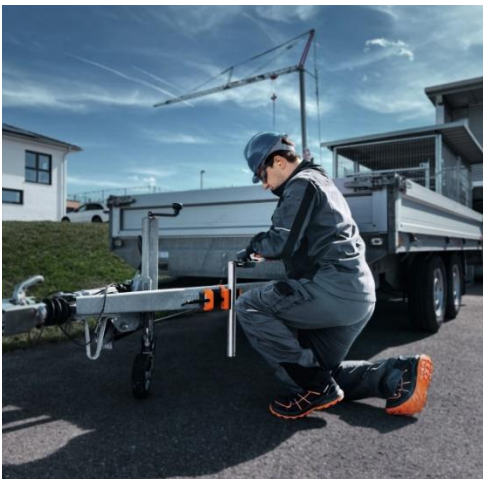
Imagen: El tornillo de banco magnético se sujeta rápidamente, de forma precisa e intuitiva en cualquier superficie magnética.

Imagen: El Sistema VersaMAG de FEIN es un solucionador de problemas: seguro y limpio en los sitios de construcción evitando largos tiempos de preparación.