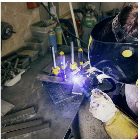
Imagen: El plato de soldadura del Sistema VersaMAG de FEIN es compacto, ligero y perfecto para un uso portátil.

Imagen: El tornillo de banco magnético se sujeta rápidamente, de forma precisa e intuitiva en cualquier superficie magnética.