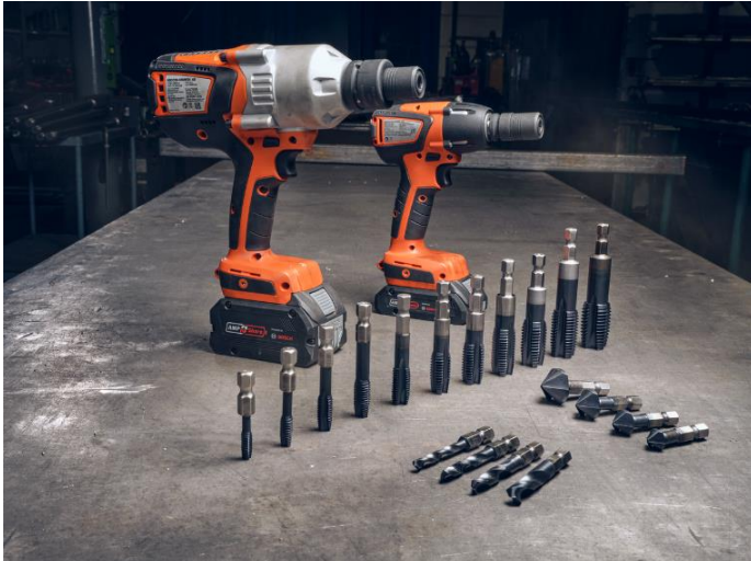
Bildunterschrift: Die 3-in-1 Revolution für Schlagschrauber mit dem FEIN VARIO Zubehör ermöglicht Bohren, Kegelsenken und Gewindebohren mit nur einer Maschine.