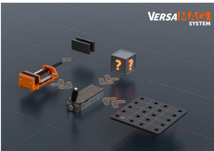
Légende : Le système FEIN VersaMAG est modulaire et extensible à l'infini. De nouveaux accessoires viennent constamment compléter le système de serrage extensible.