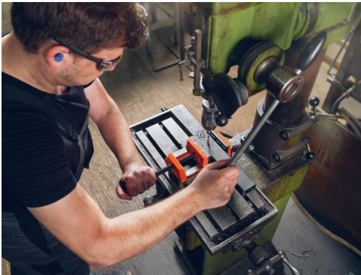
Légende : Alignement précis de l'étau magnétique grâce à une prémagnétisation de 30 %.