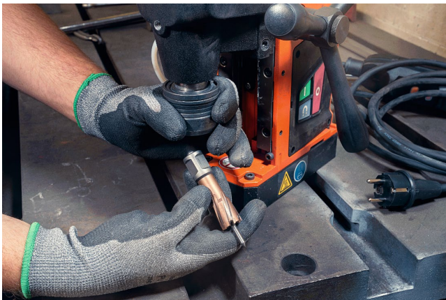
Bildunterschrift: Halbiert die Bohrzeiten im System: Der HM ULTRA SPEED 35 Kernbohrer der KBE 36 MAGSPEED verdoppelt die Produktivität und ermöglicht pro Arbeitsstunde bis zu 60 Kernbohrungen.