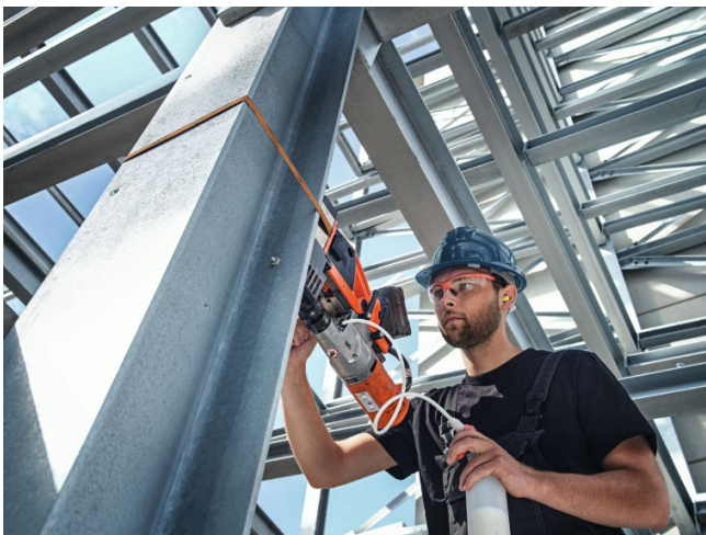
Bildunterschrift: Die AKBU 35 PMQW AS bietet eine sichere und intuitive Bedienung durch den leistungsstarken Permanentmagnet mit Vormagnetisierung und dem Kippsensor.