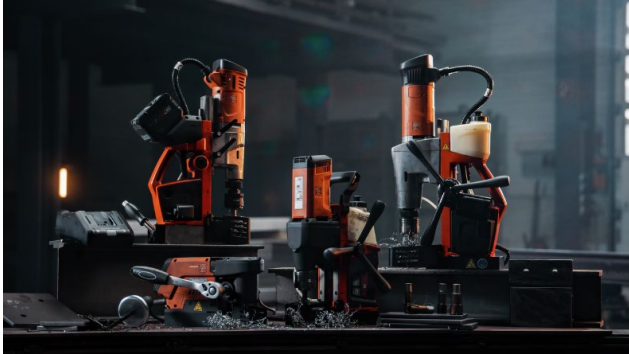
Bildunterschrift: Die Klassen der Kernbohrer: Endurance, Compact, Universal und Automatic.

Die hochauflösenden Fotos finden Sie zum Download im FEIN Pressebereich unter: www.fein.at/presse