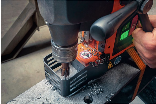
Bildunterschrift: Trotz des extrem leistungsstarken bürstenlosen 1.600 W-Hochleistungsmotor bringt die KBE 36 QW MAGSPEED nur 11,0 kg Maschinengewicht auf die Waage.