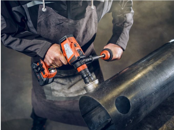
Bildunterschrift: Multifunktioneller Einsatz und so vielseitig wie kein anderer Akku-Bohrschrauber: Der FEIN ASCM 18-4 QM(P) AS.