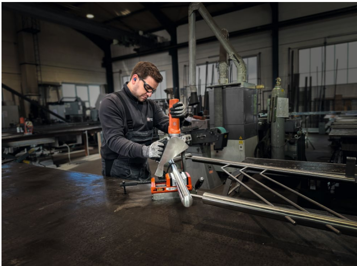
Bildunterschrift: Die Erweiterung des FEIN VersaMAG Systems mit den Schutzbacken aus Aluminium verspricht neues Zubehör für empfindliche Werkstücke.

FEIN Elektrowerkzeuge sind im Fachhandel erhältlich. Bezugsquellen unter: www.fein.com/de_at/haendlersuche/