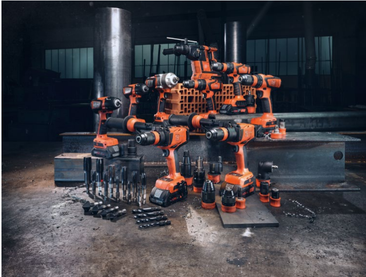
Bildunterschrift: Neue Dimensionen mit dem FEIN Bohr- und Schlagschrauber-Sortiment.

Die hochauflösenden Fotos finden Sie zum Download im FEIN Pressebereich unter: www.fein.at/presse