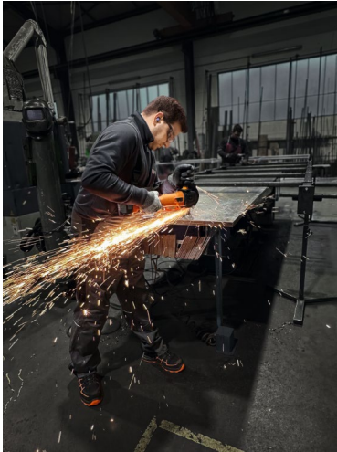
Bildunterschrift: Starke Schleifer. Jetzt noch stärker mit 1.200 Watt.

Die hochauflösenden Fotos finden Sie zum Download im FEIN Pressebereich unter: www.fein.at/presse