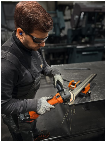
Bildunterschrift: Sicheres und vibrationsarmes Arbeiten mit dem neuen FEIN Anti-Vibrationshandgriff.