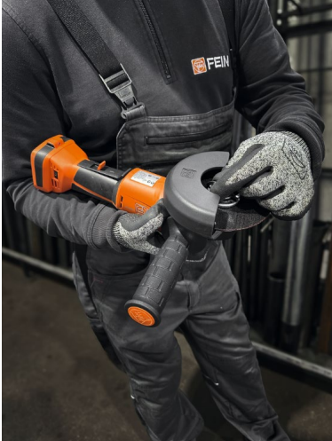
Bildunterschrift: 21% weniger Vibration am Handgriff für ergonomisches, sicheres und längeres Arbeiten im Vergleich zum vorherigen Anti-Vibrationshandgriff.