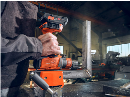
Bildunterschrift: Die VARIO 3-in-1-Konstellation verspricht Spiralbohren, Kegelsenken und Gewindebohren – alles mit nur einer Maschine.