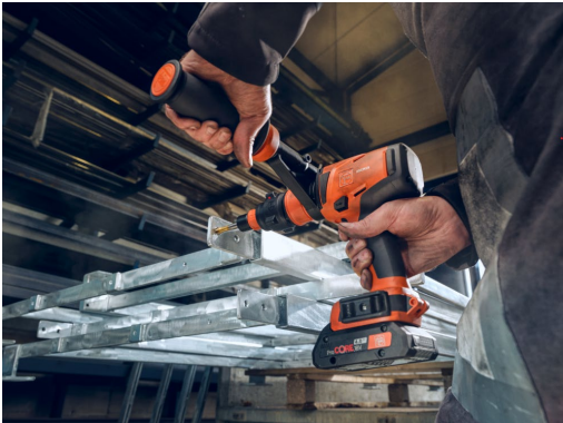
Bildunterschrift: Mit dem FEIN VARIO-Zubehör ist handgeführtes Gewindebohren bis zu M30 kein Problem mehr.