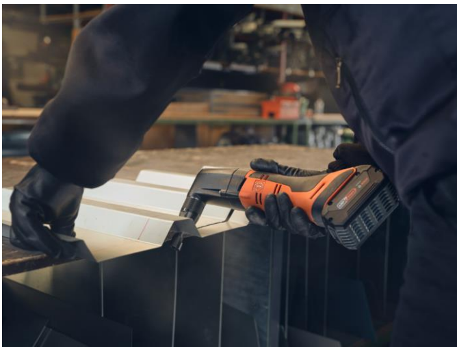
Bildunterschrift: Der ABLK 18 1.6 E zeichnet sich durch seine Wendigkeit aus. Mit ihm sind präzise Schnitte in Trapez- und Wellblechen möglich.