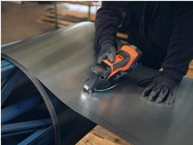
Bildunterschrift: Kurven und Radien sind mit den FEIN Bleischeren keine Herausforderung mehr.