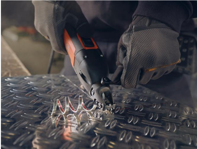
Bildunterschrift: Die FEIN Schlitzschere BSS 1.6 CE ermöglicht schnelle und saubere Schnitte mit dem integrierten Spanabtrenner.