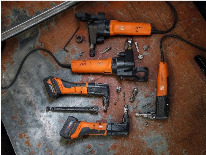
Bildunterschrift: Die FEIN Knabberfamilie

Die hochauflösenden Fotos finden Sie zum Download im FEIN Pressebereich unter: www.fein.de/presse